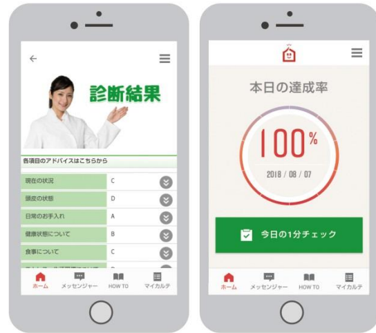
（イメージ：スマホアプリの画面）

AGA 医薬品を服用中の方にもおすすめいたします。新サービス開始を記念して、今なら初月無料（2019年8月31日まで）でご利用いただけます。