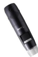
頭皮撮影用 スコープ