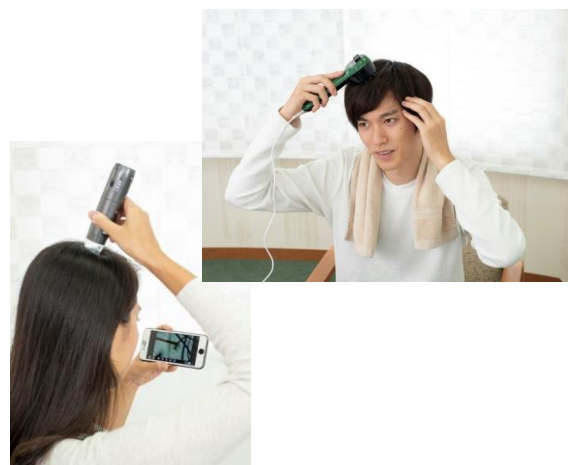
（写真：ホームケアの様子／スコープ頭皮チェックの様子）

「頭皮や毛根の診断」「髪の悩み解消に向けてのカウンセリング」「日々のケア管理」が、すべてアプリ上で行えます。アプリ内のメッセージャーでつながるリーブ 21 の発毛診断管理士が、お客様をサポートします。