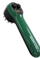
最新ホームケア機具 マックセル