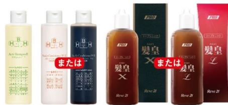
(写真上: ホームケア商品)

リーブ21は創業以来一貫して発毛の研究をつづけ、髪と頭皮により天然成分を多数発見し、学会に発表しています。そのエビデンスを生かした独創のヘアケア商品を、毎月お客様のご自宅へお届けします。