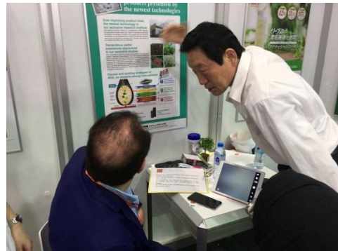
(写真上：岡村社長が発毛理論を説明)

発毛診断管理士による頭皮チェックでは、アラブ服を自ら脱いで積極的に受診されていました。