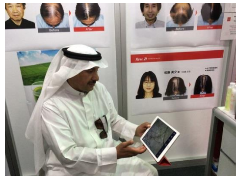
(写真上下：頭皮チェックの様子)