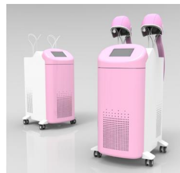
（写真上：頭皮冷却装置）