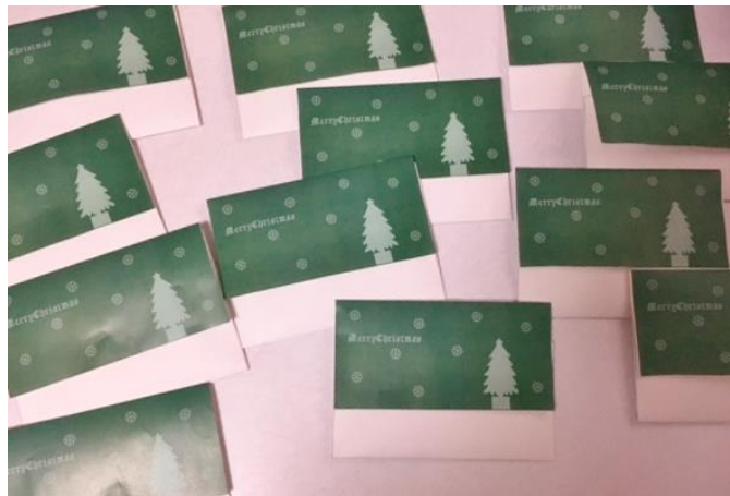
(写真上：発送直前のクリスマスカード)

リーブ 21 は、2014年12月より、国際協力NGO団体「チャイルド・ファンド・ジャパン」を通じて、貧困な暮らしを送るフィリピンやスリランカの子供たちを学校へ通えるように支援しています。また、現地の子供たちへクリスマスカードを送って、遠く離れた日本から、子供たちの成長を見守っています。