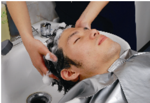
【スカルプシャンプー】