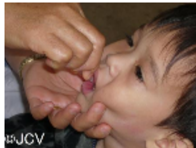
ワクチンの投与を受ける子ども

リーブ21のオリジナルシャンプーやコンディショナー、また、ペットボトルなどのキャップは、ゴミとして捨てれば、焼却処理されCO2が排出されてしまいます。しかし、再生資源化することによって地球温暖化の防止にも貢献することができます。