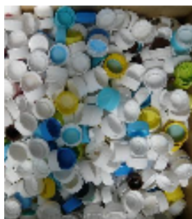
集まったキャップの一部と社員

当社では、発展途上国の子どもたちに日本からでもできる支援はないか考え、身近にある使わなくなったキャップを集めることで、ミャンマー、ブータン、ラオスなど東南アジア諸国の子どもたちにワクチンを提供するというJCVの活動に参加してまいりました。集められたキャップは、NPO団体を通じて、リサイクル製品製造所に売却され、その売却益をJCVへ寄付。JCVがワクチンを購入し支援先国へ贈られています。また、売却したキャップは、雨水貯留浸透製品などのプラスチック製品として再生されています。